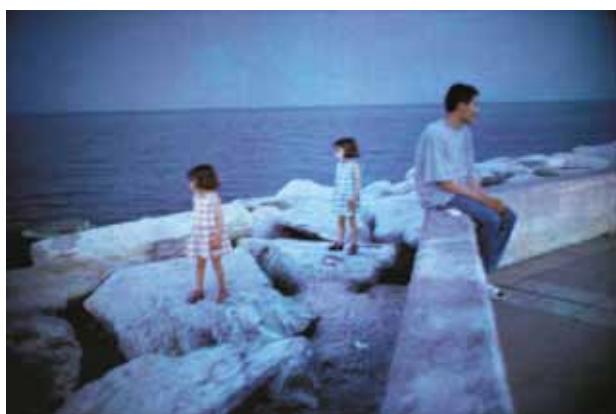
Dolorès Marat « Les deux petites filles devant la mer à Bastia » Extrait de « La ville, la nuit », 1998