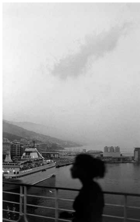
Bernard Plossu « Bastia, 2000 »