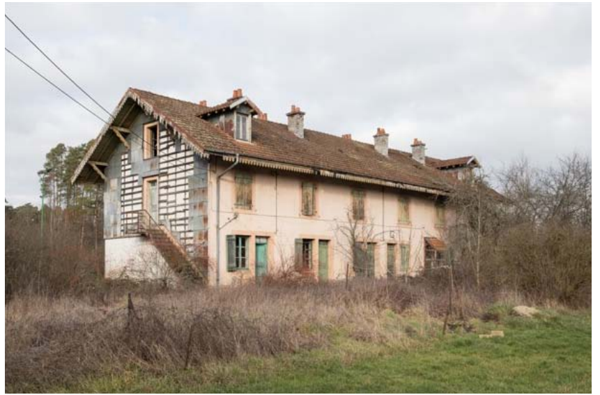
Nelly Monnier, Atlas des Régions Naturelles : Vôge, Lambrequins , gouache sur papier, 42 x 60 cm, 2019. Éric Tabuchi, Atlas des Régions Naturelles : Vôge, Demangevelle-les-Cités , tirage jet d'encre, 40 x 50 cm, 2019.