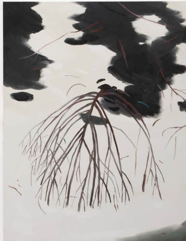
Nelly Monnier, Frimaire , huile sur toile, 116 x 89 cm ; Nivôse , huile sur toile, 116 x 89 cm ; 2019