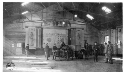
Vue intérieure du garage employé précédemment comme théâtre par les Français, 1918.