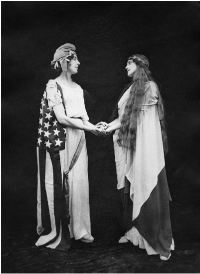
Les images présentées dans ce communiqué sont libres de droits uniquement dans le cadre de la promotion de cette exposition au Théâtre Jacques Carat, Cachan, du 18 septembre au 16 novembre 2018.

Parmi ces images aujourd'hui conservées par la Médiathèque de l'architecture et du patrimoine, nombreuses sont celles qui s'intéressent à la vie quotidienne des soldats et qui retrace l'activité théâtrale à l'arrière des tranchées. On y découvre les répétitions des troupes professionnelles ou d'amateurs, les représentations destinées à distraire les troupes au repos ainsi qu'une étonnante archive présentant les décors réalisés par la peintre Georges Scott pour le théâtre aux armées