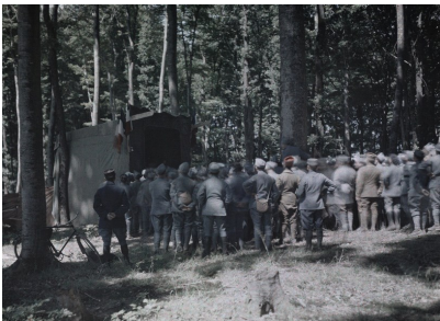
Spectacle patriotique, l'Amérique et la France se tenant par la main, Paris, 1918