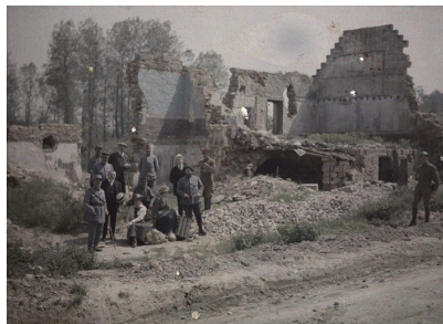
Les artistes du théâtre aux Armées dans les ruines de Vauxrezis, 1917