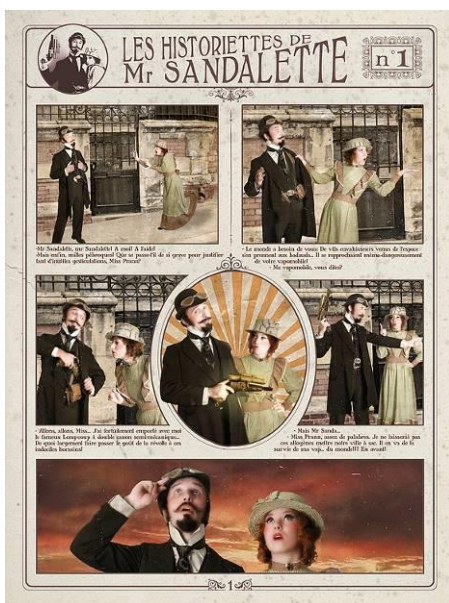
Les Historiettes de M. Sandalette, tous droits réservés Anxiogène/Futuravapeur, 2007

Les aventures de Maurice Sandalette, anti-héros normand uchronique, se déclinent sous la forme d'un roman-photos rétro colorisé. Ces historiettes se regardent aussi bien en une seule planche qu'en série. Elles seront mises en scène à côté d'objets issus des réserves du musée et sélectionnés par Futuravapeur. Une façon originale de découvrir une partie inconnue des collections du musée Thomas Henry ! L'exposition s'inscrit dans la programmation de Voyageurs Immobiliers