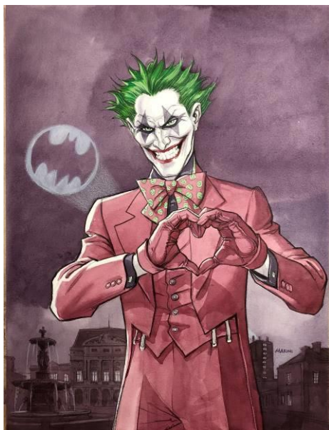
TM©DC Comics Illustration Enrico Marini All Rights Reserved

Après le succès le succès rencontrés lors de la première édition en 2017, le festival consacré à la pop culture « Voyageurs immobile » investit à nouveau le Quasar.