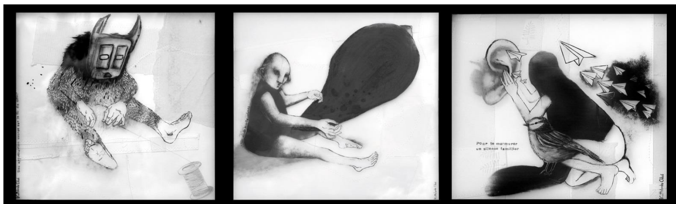
De g. à d.: Chloé COTTALORDA, Une appréhension sacré sur le fil du désir / Le désir par contumas / Pour te murmurer un silence familier , grisaille sur feuille de verre. © C. COTTALORDA

Les textes en italiques sont issus d'une interview de l'artiste pour la revue Vibration Clandestine.