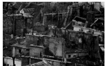
Gare Saint-Lazare, Paris, 1959