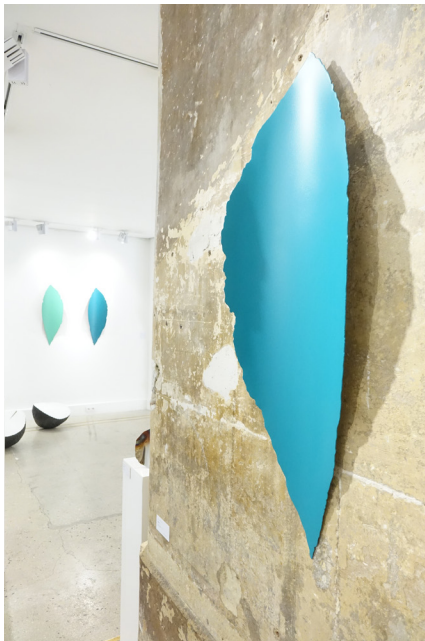
Bribes 2019, acier Corten et laque, 94 x 32 x 7 cm