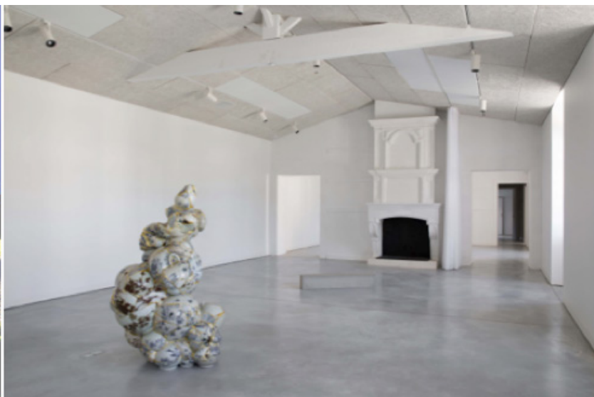
Yeesooyung, Translated Vase, 2010 Ceramic trash, epoxy, 24k gold leaf - 158x90x90cm