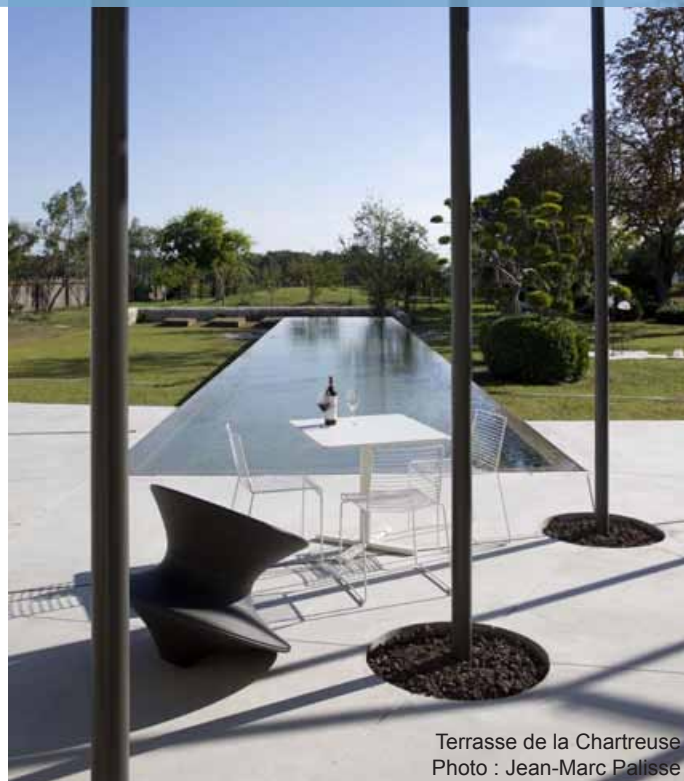
Terrasse de la Chartreuse