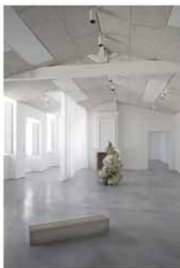
Yeesookyung , Translated Vase, 2010 Ceramic trash, epoxy, 24k gold leaf - 158x90x90cm