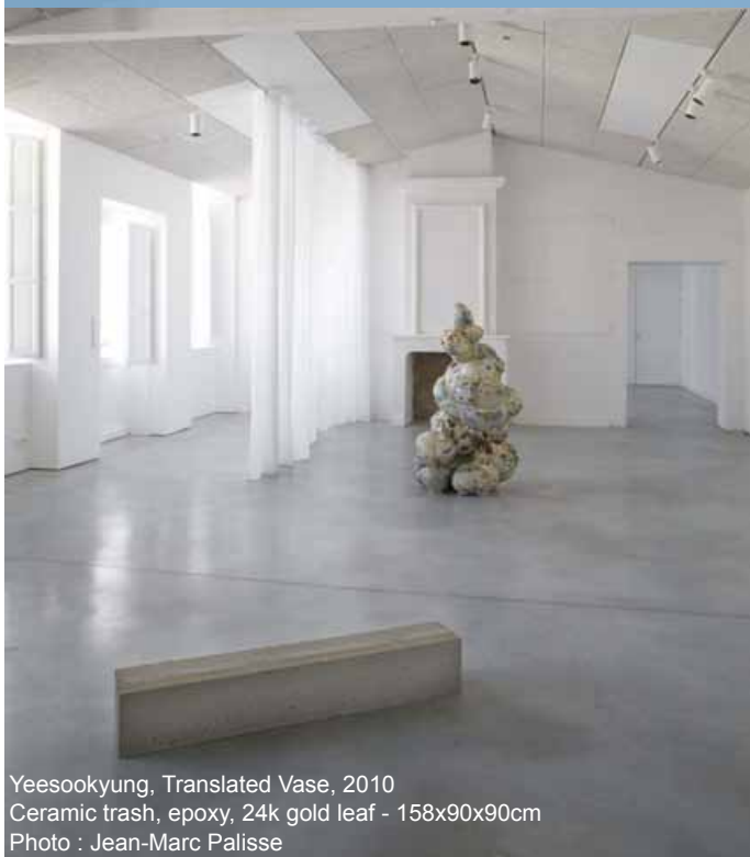
Yeesookyung, Translated Vase, 2010 Ceramic trash, epoxy, 24k gold leaf - 158x90x90cm

Si « le vin est un projet esthétique et gourmand », l'art est un projet esthétique et intellectuel.