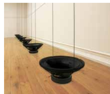
Rolf Julius , Singing , 2000/2015 - 7 haut-parleurs, pigment noir, câbles, lecteur CD, amplificateur variable