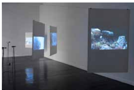
Rolf Julius , Untitled , 2010 / 2013 - 6 vidéos, papier coréen, pincés, fil de fer, vidéo projecteurs, trépieds