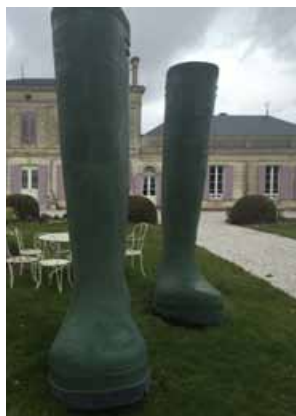
Lilian BOURGEAT Invendu - Bottes