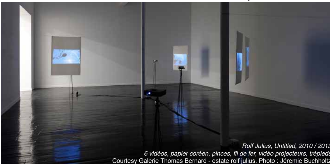
Rolf Julius, Untitled , 2010 / 2013 6 vidéos, papier coréen, pinces, fil de fer, vidéo projecteurs, trépieds Courtesy Galerie Thomas Bernard - estate rolf julius. Photo : Jérémie Buchholtz

Galerie Thomas Bernard – Cortex Athletico / estate rolf julius