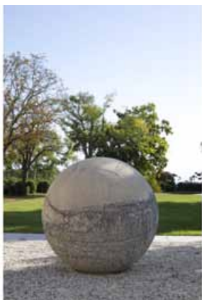
Vincent GAVINET Contremesure (2013) © Jean-Marc Palisse