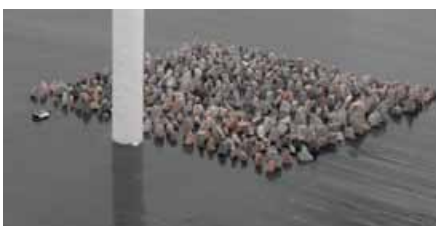
Rolf Julius , Large stonegarden (monochrome), 2010 - Pierres, 3 haut-parleurs, lecteur MP3, câbles, audio - environ 165 x 165 cm