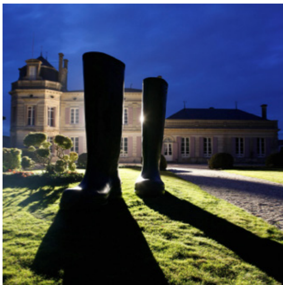
Lilian Bourgeat, Invenu, Bottes, 2006. Fibre de carbone - 3mx2mx80cm