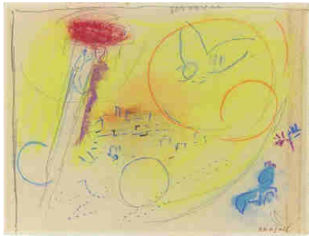
Marc Chagall (1887-1985) Dessin préparatoire pour Le Cantique des Cantiques III , 1960

Musée national Marc Chagall, Nice