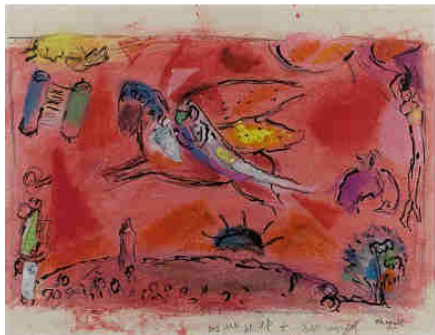
Marc Chagall (1887-1985) Etude préparatoire pour Le Cantique des Cantiques IV , 1958

Musée national Marc Chagall