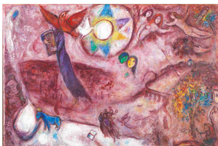
Marc Chagall (1887-1985) Le Cantique des Cantiques V , 1965 - 1966