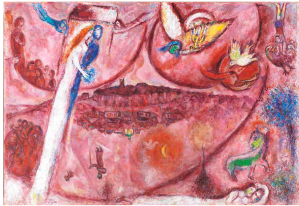
Marc Chagall (1887-1985) Le Cantique des Cantiques III , 1960