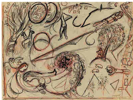
Marc Chagall (1887-1985) Dessin préparatoire pour Le Cantique des Cantiques , 1960

Musée national Marc Chagall, Nice