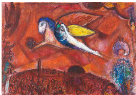
Marc Chagall (1887-1985) Le Cantique des Cantiques IV , 1958