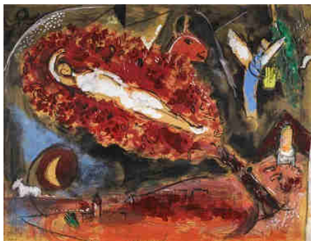
Marc Chagall (1887-1985) Le Cantique des Cantiques II , 1957

Musée national Marc Chagall, Nice