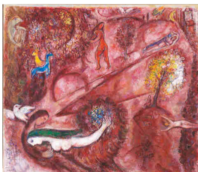
Marc Chagall (1887-1985) Le Cantique des Cantiques I , 1960

Musée national Marc Chagall, Nice