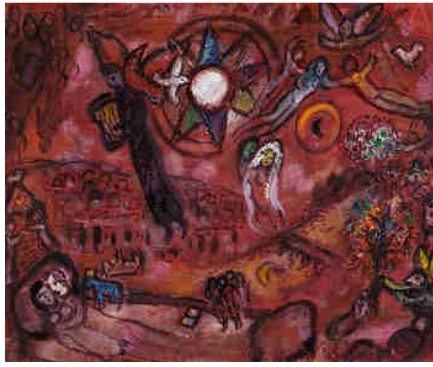
Marc Chagall (1887-1985) Esquisse pour Le Cantique des Cantiques V , 1965-1966