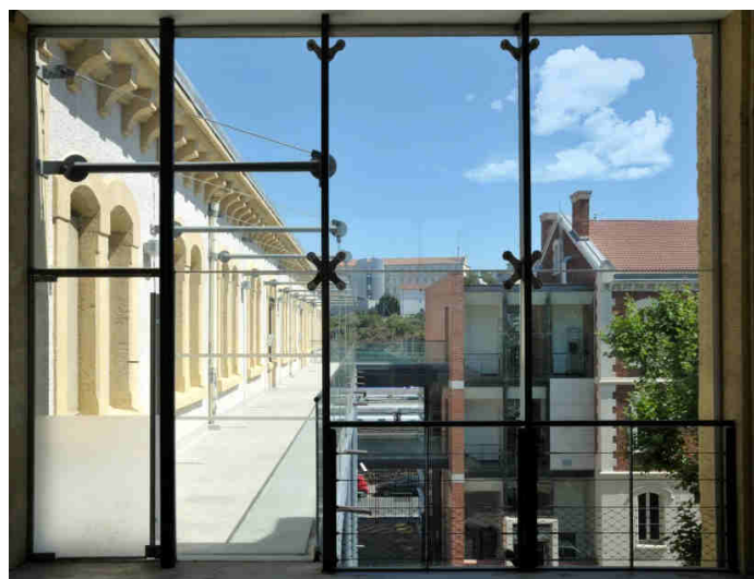
Vue du CICRP

Le Centre Interdisciplinaire de Conservation et de Restauration du Patrimoine (CICRP) est implanté à Marseille, dans le quartier de la Belle-de-Mai. Il offre une surface de 6500 m 2 répartie entre des bureaux, des laboratoires, des réserves et des ateliers. Ses domaines d'intervention concernent la conservation préventive et la restauration du patrimoine culturel, dans le respect des exigences du Code du Patrimoine.