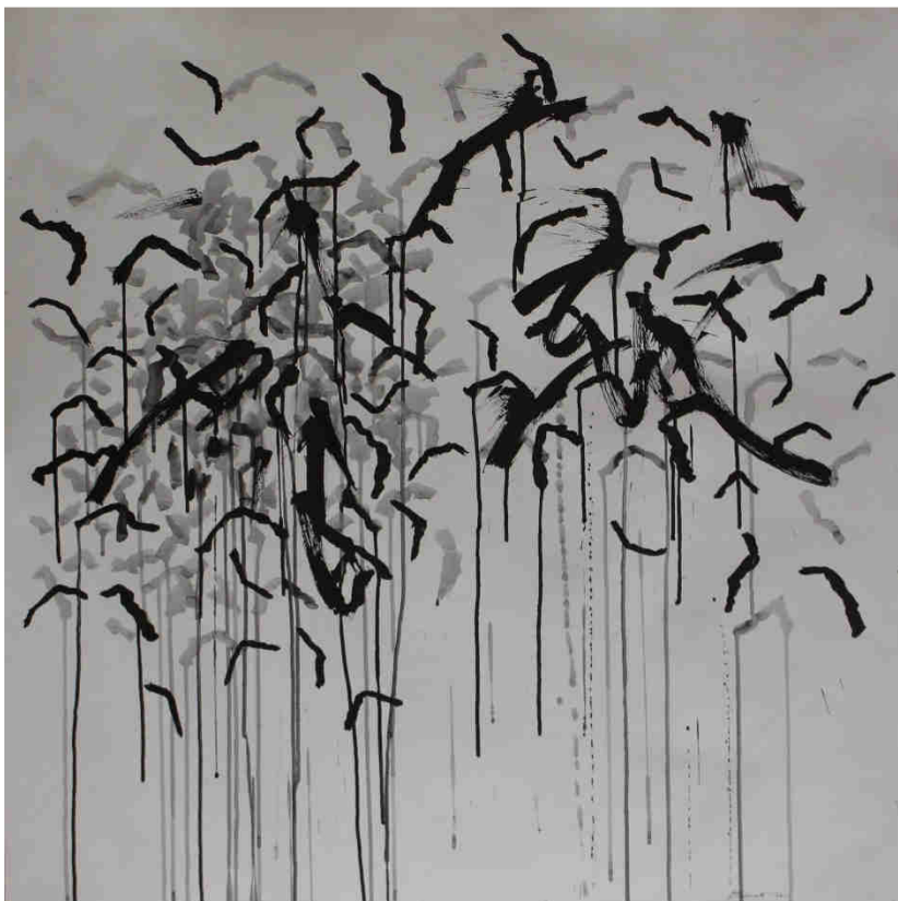
JEAN-MARC BRUNET | LIEU RECHERCHE | 2016 | 93 X 93 CM | ENCRE DE CHINE, PASTEL SEC