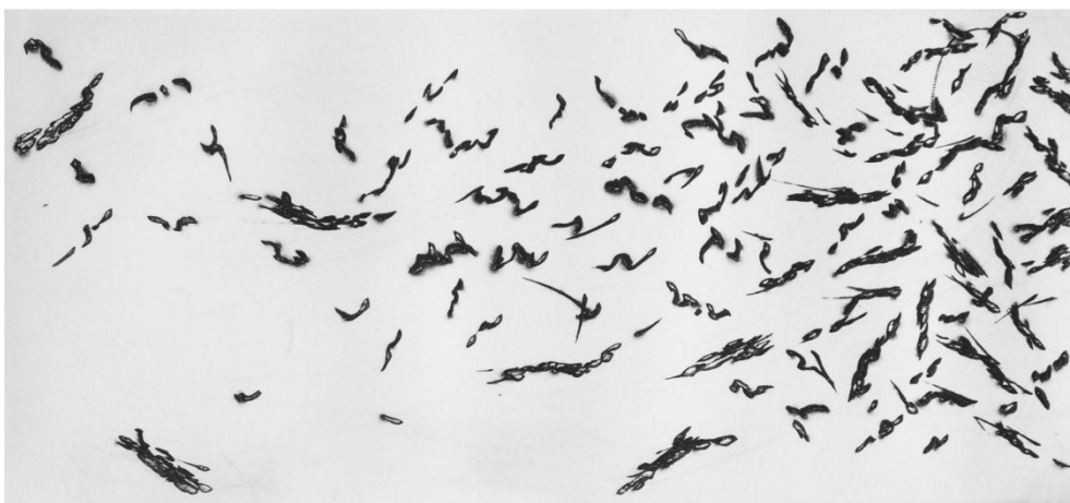
JEAN-MARC BRUNET | DEPAYSAGE | 2015 | 12X26 | GRAVURE