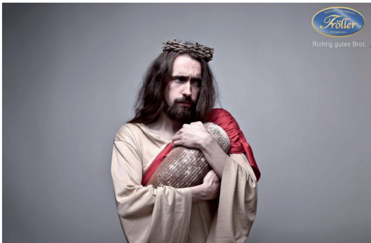
Tröller, Allemagne, 2011