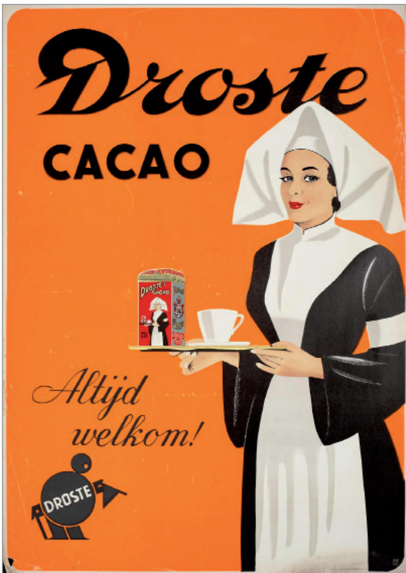
Droste, Pays-Bas, années 1950–1960