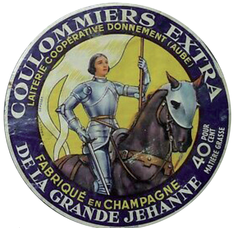
Coulommiers de la Grande Jehanne, France, années 1930