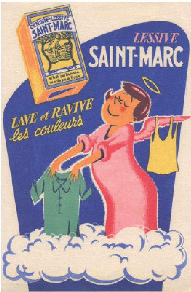
Saint-Marc, France, 1969