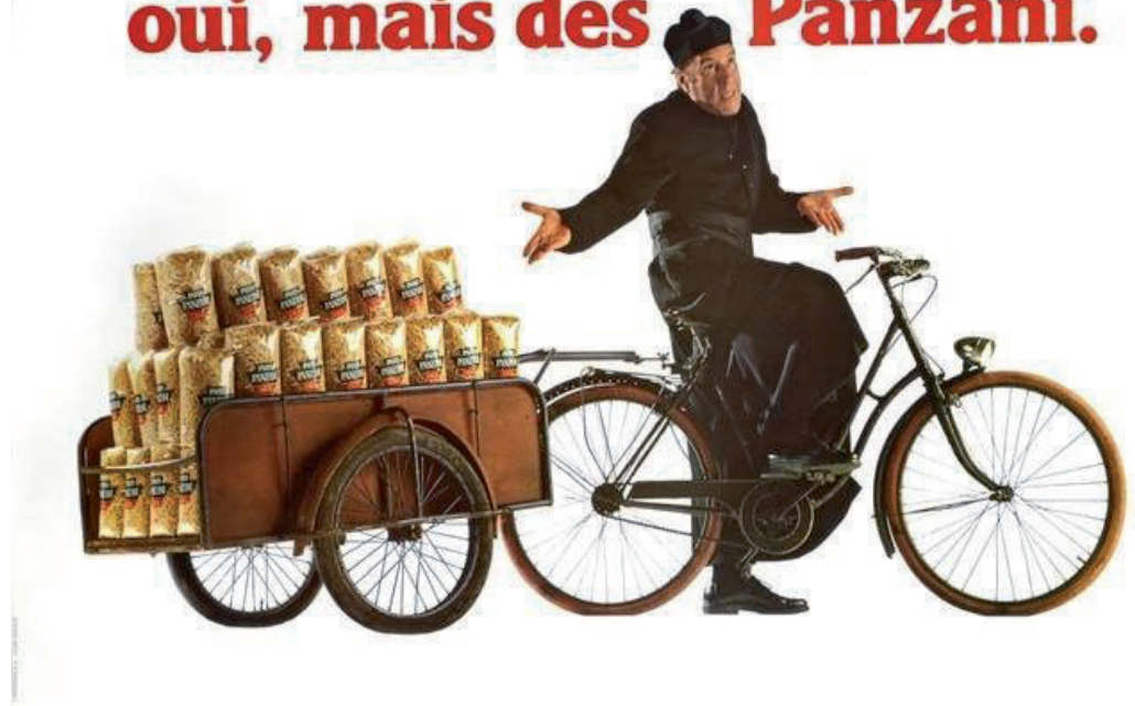
Panzani, France, 1975–2000