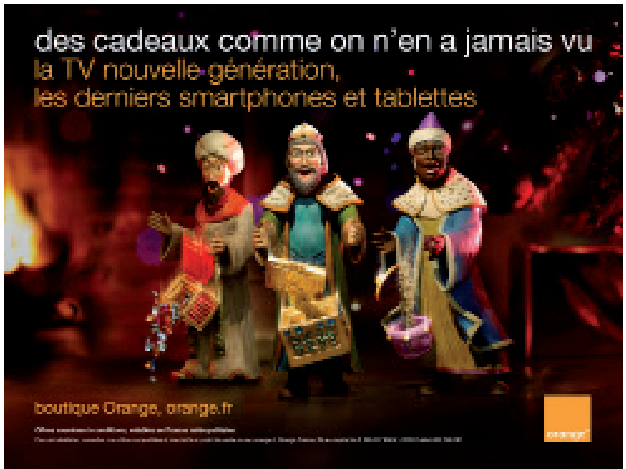
Orange, France, 2012