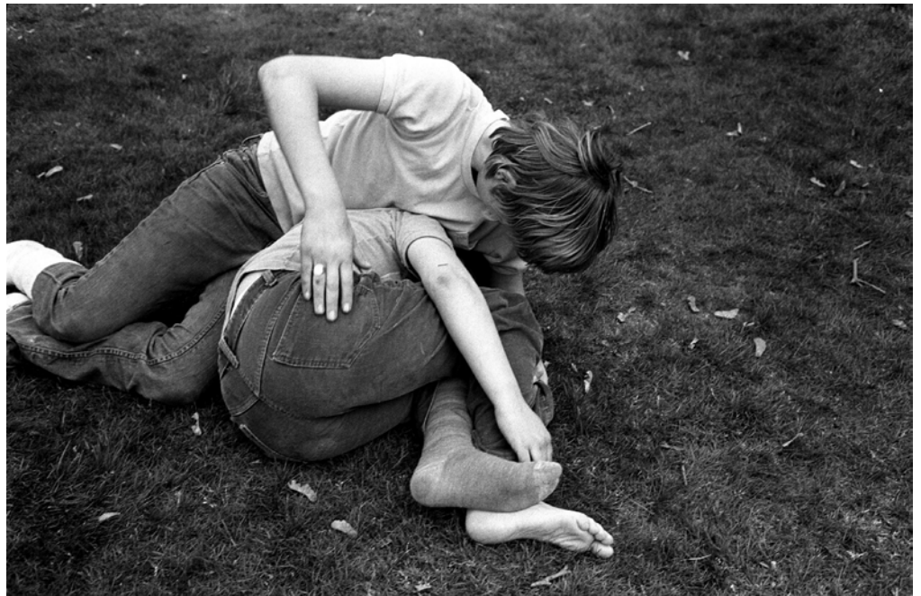
Stephen Shames, Vancouver, British Columbia, Canada: young teenagers wrestle in the grass at a park , 1975