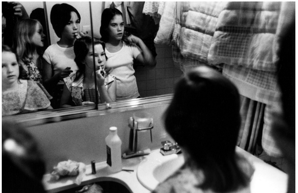
Stephen Shames, New York, USA: Girls apply make-up , 1976