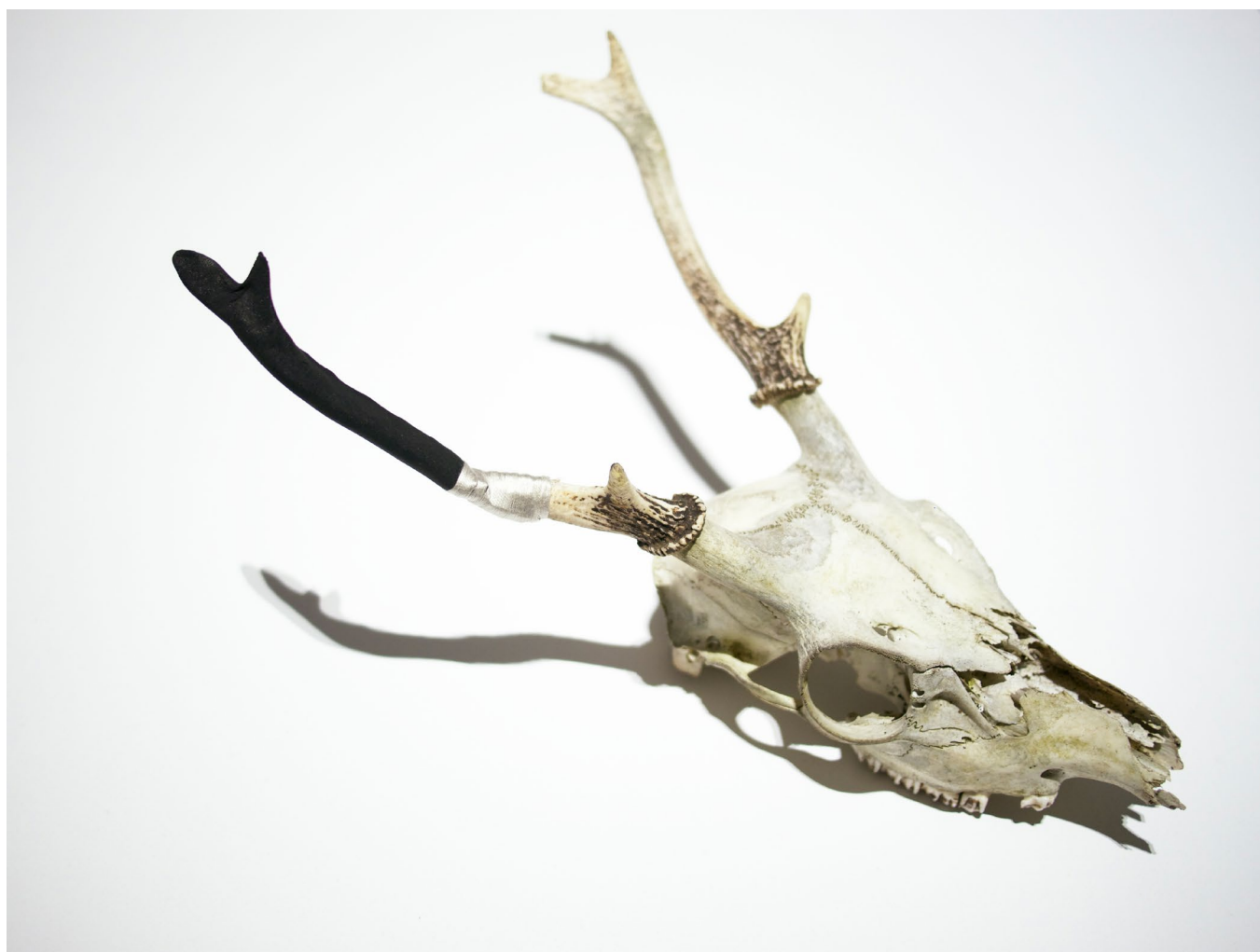
Kodo , tête de cerf, bâton d'encre de chine, fil, 2017 39.5 cm x 22.7 cm x 20 cm