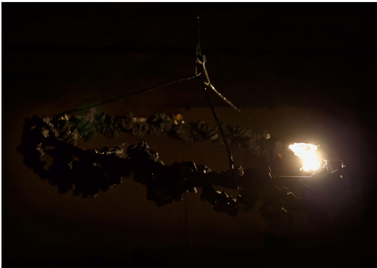
ECSC01, charbon, câble, métal, 2019, 95 cm x 15 cm

Auteure, critique d'art, commissaire d'exposition indépendante.