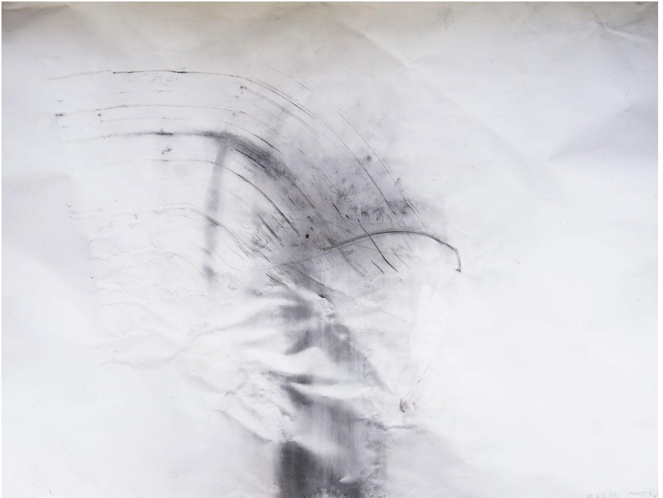
Moon light drawing 08 , Dessin, Encre de chine sur papier, 2019 150 cm x 200 cm