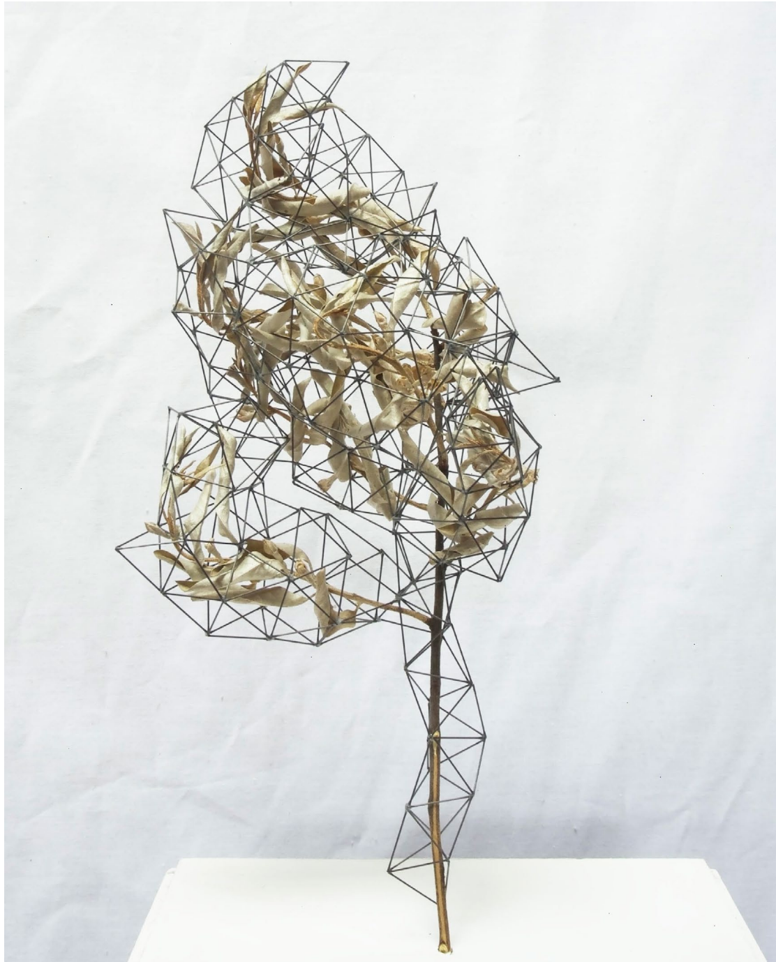
Graphite Sculpture 4.5, Fleur séchée, graphite, colle, 2018 12 cm x 12 cm x 28 cm