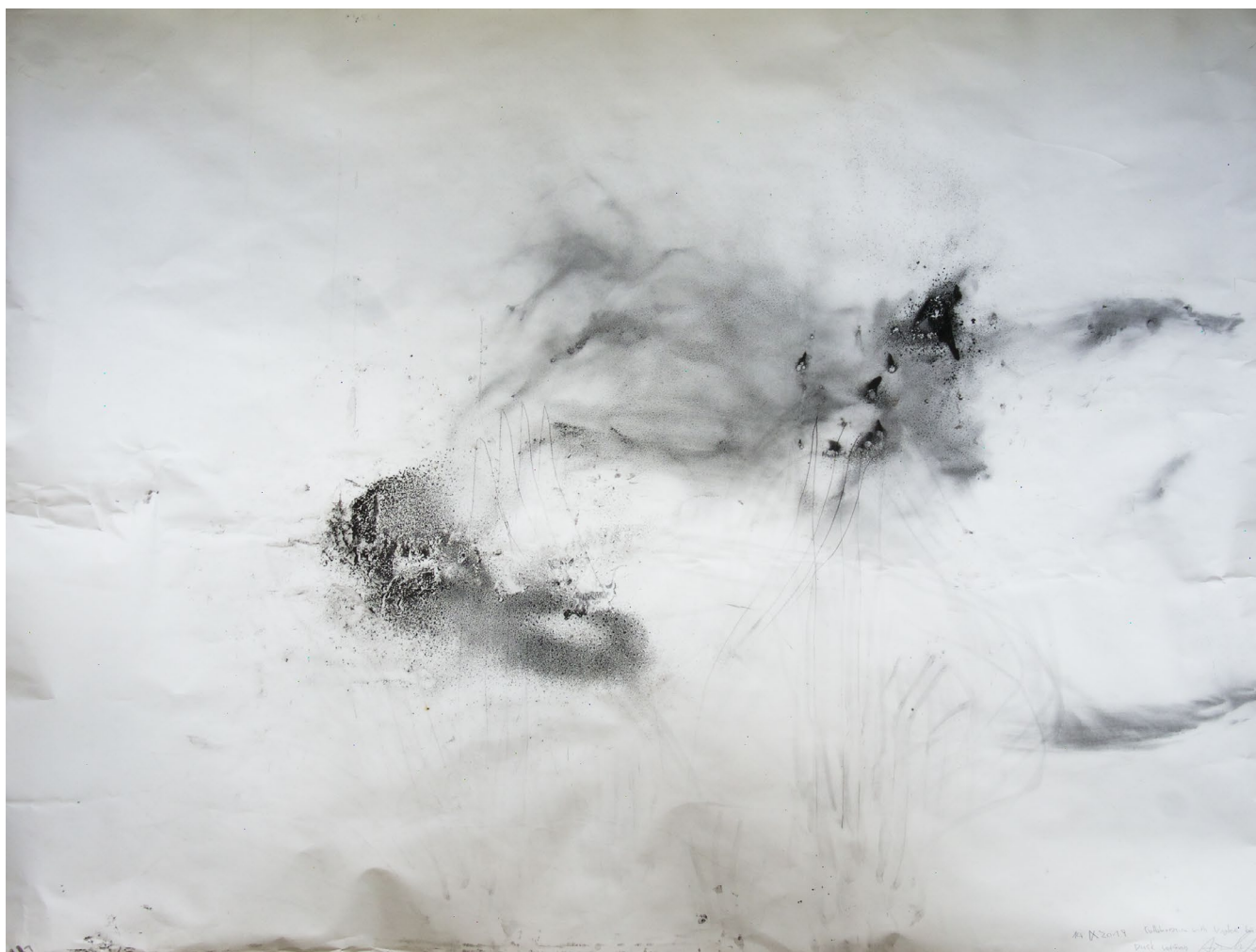
Moon light drawing 06 , Dessin, Encre de chine sur papier, 2019 150 cm x 200 cm