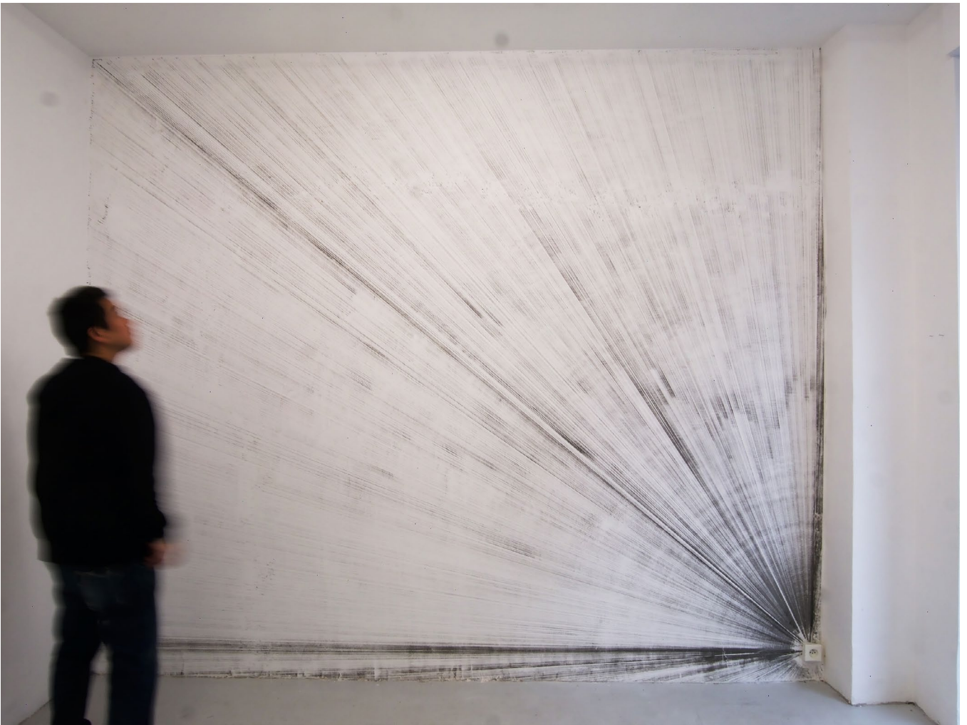
Carbon variation N°12, Dessin mural, 2019 250 cm x 300 cm