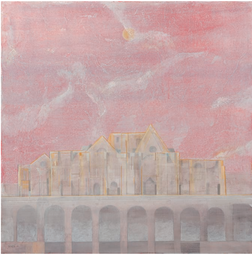
Paesaggio technique mixte sur toile - 80 x 80 cm - 2016