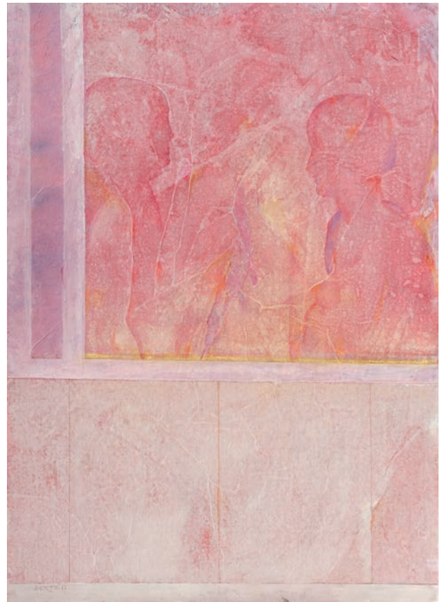
Specchio technique mixte sur carton - 70 x 50 cm - 2017