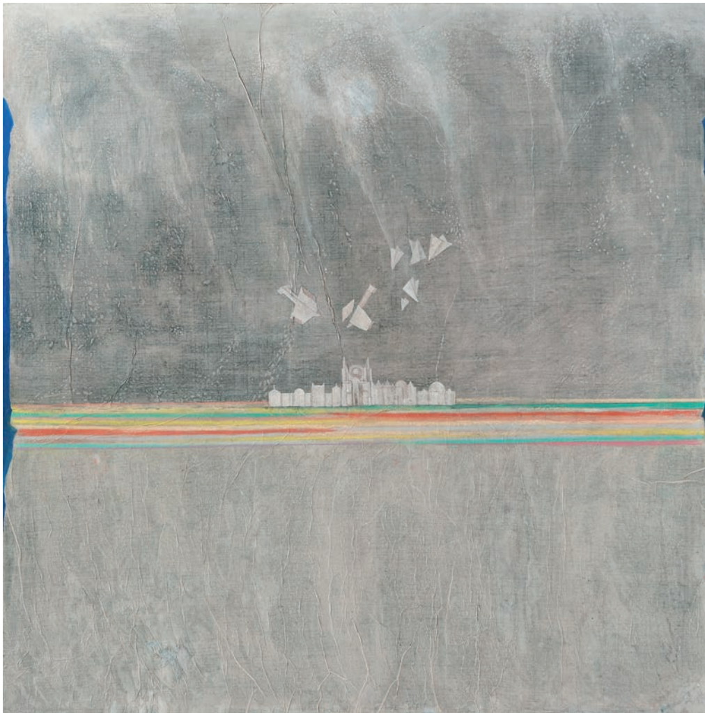
Incidente aereo marouflage sur toile - 100 x 100 cm - 2017