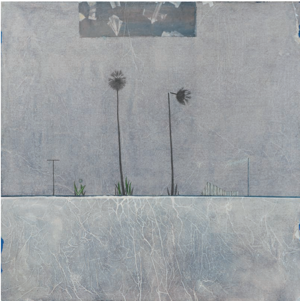
Due palme marouflage sur toile - 100 x 100 cm - 2017