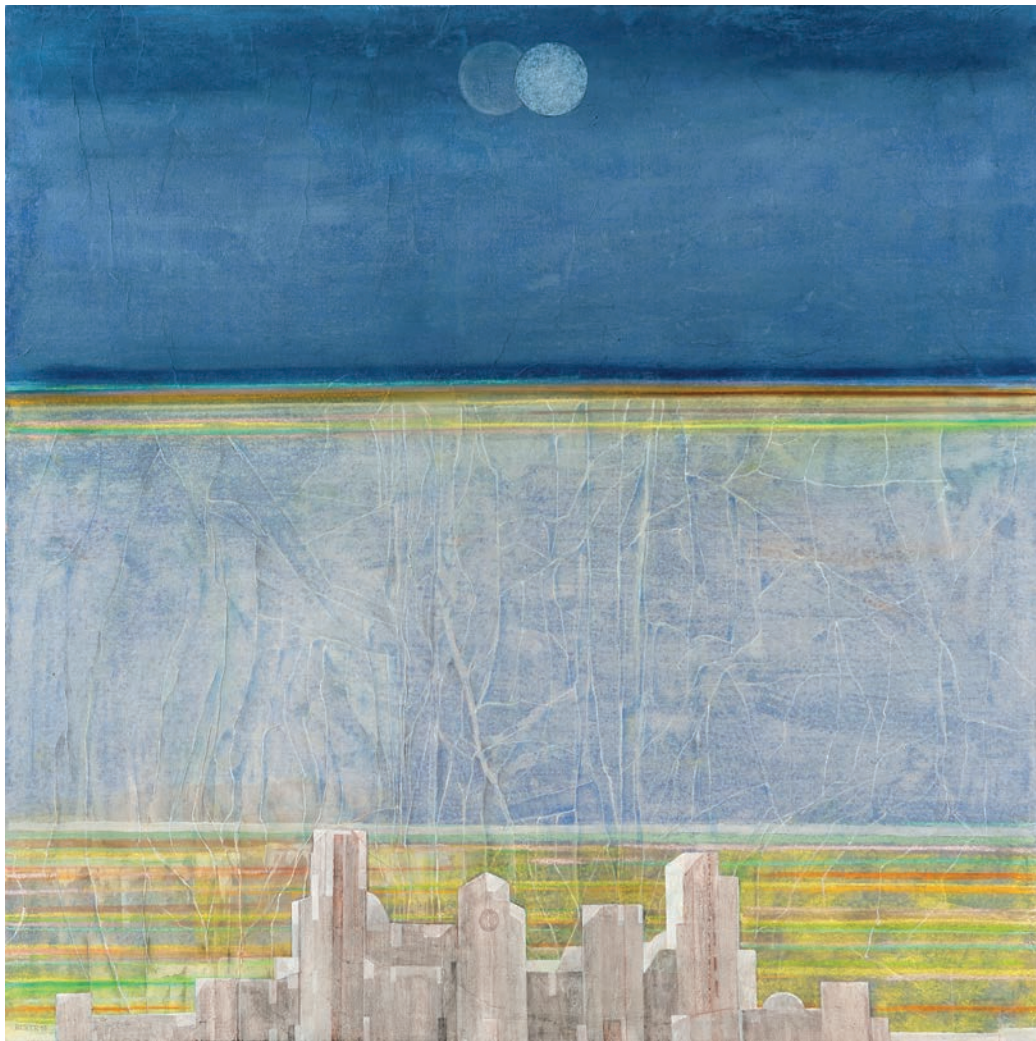
Dopia luna marouflage sur toile - 100 x 100 cm - 2017