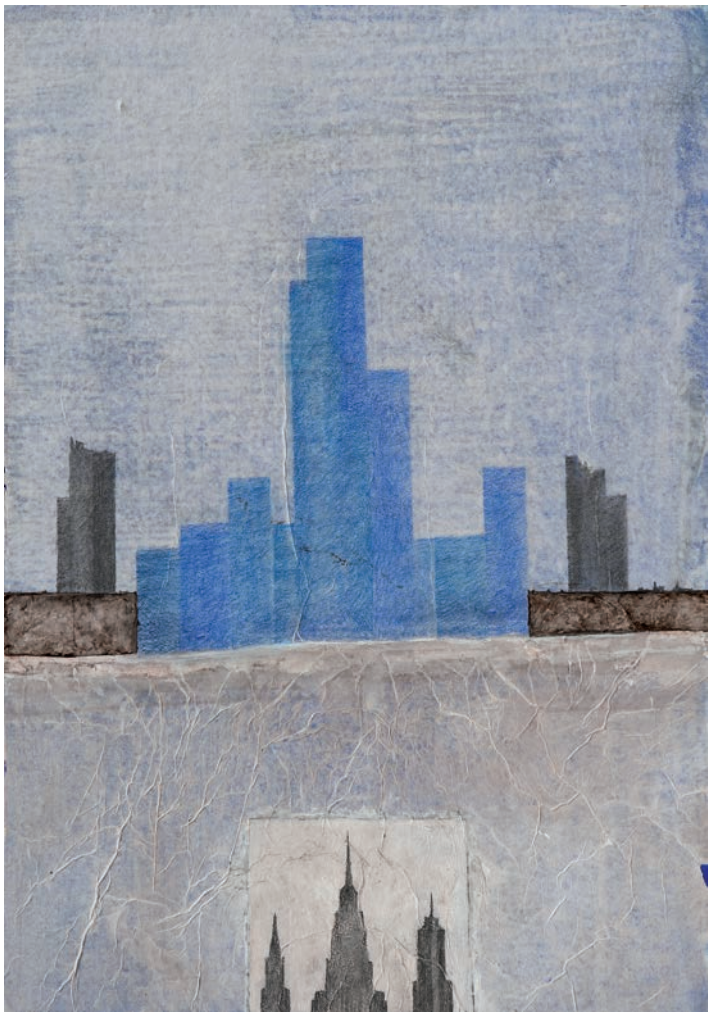
N.Y. technique mixte sur carton - 50 x 35 cm - 2017