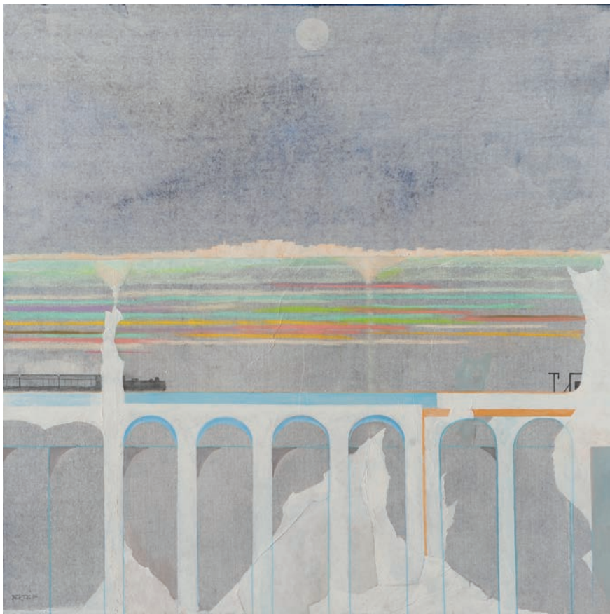
Treno technique mixte sur toile - 80 x 80 cm - 2017