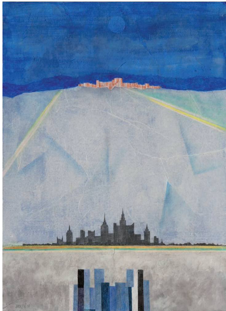
Brooklyn technique mixte sur toile - 70 x 50 cm - 2017