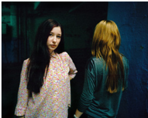
Bucarest, Roumanie, 2015 © European Puzzle Jean-Christophe Béchet