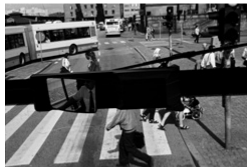
Göteborg, Suède, 2003