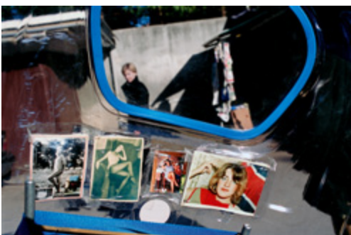
Pise, Italie, 1999

Les visuels de presse sont en libre exploitation dans l'unique but de la promotion de l'exposition « European Puzzle » du 27 avril au 26 août 2018. Les visuels libres de droit doivent être légendés et crédités tels qu'indiqués dans l'iconographie. Merci de nous adresser une copie de la publication.