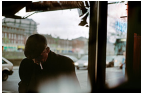
Dublin, Irlande, 1999 © European Puzzle Jean-Christophe Béchet