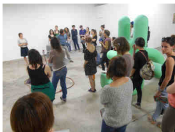
Visite d'exposition, « Mères austères / Austerity mums », BBB centre d'art, 2014