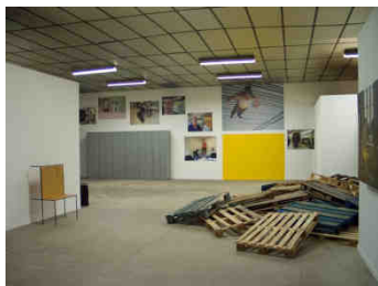
Alain Bernardini, arrière plan, vue d'exposition « Que reste-t-il », BBB centre d'art, 2010