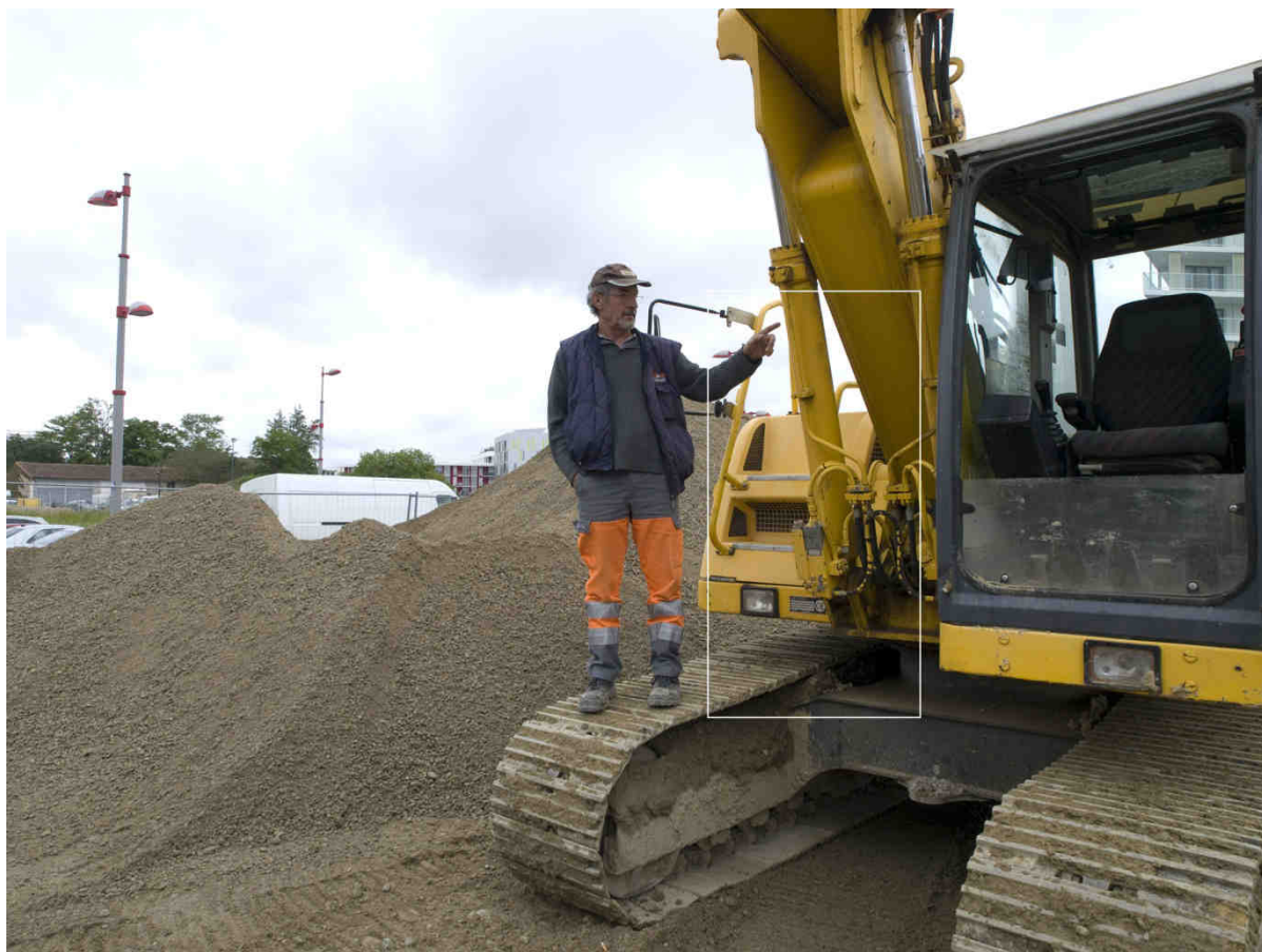
Alain Bernardini, « Origine. Le Recadrage pour les Porte-Images. Serge, Le touché # 5. Borderouge Nord. Toulouse 2013 » Commande publique de photographies du Centre national des arts plastiques - ministère de la Culture et de la Communication