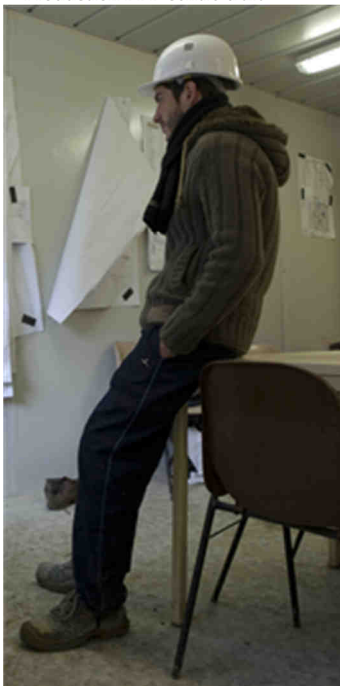
Alain Bernardini « Recadrée. Porte-Image. Nicolas, Stop # 122, Borderouge Nord. Toulouse 2013 », Impression sur affiche dos bleu 200 x 100 cm, Commande publique du Centre national des arts plastiques - ministère de la Culture et de la Communication. Production BBB centre d'art