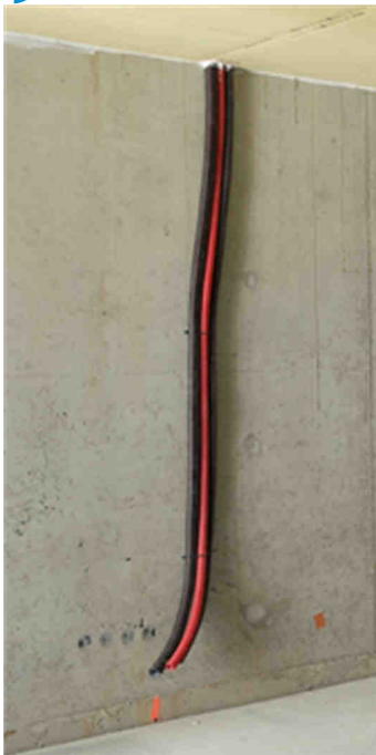
Alain Bernardini, « Recadrée. Porte-Image. Dedans # 201, Chantier. Borderouge Nord. Toulouse 2013 », Impression sur affiche dos bleu 200 x 100 cm. Commande publique du Centre national des arts plastiques - ministère de la Culture et de la Communication Production BBB centre d'art