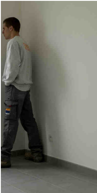
Alain Bernardini, « Recadrée. Porte-Image. Luc, Le Touché # 3. Borderouge Nord. Toulouse 2013, » Impression sur affiche dos bleu 200 x 100 cm Commande publique du Centre national des arts plastiques- ministère de la Culture et de la Communication. Production BBB centre d'art