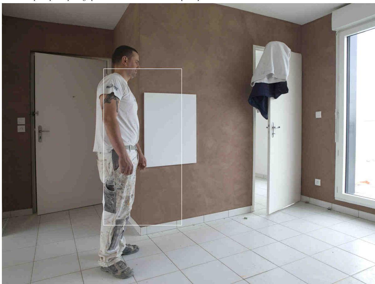
Alain Bernardini, « Alain Bernardini, Origine. Le Recadrage pour les Porte-Images. Xavier, Stop # 123. Borderouge Nord. Toulouse 2013 » Commande publique de photographies du Centre national des arts plastiques - ministère de la Culture et de la Communication