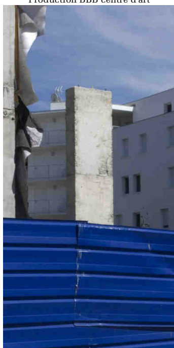
Alain Bernardini « Recadrée. Porte-Image. Dehors # 136, Chantier. Borderouge Nord. Toulouse 2013 », Impression sur affiche dos bleu 200 x 100 cm Commande publique du Centre national des arts plastiques - ministère de la Culture et de la Communication. Production BBB centre d'art

_ sur rendez-vous | durée 2h | 3 €/participants Visite interactive pour une co-découverte de l'œuvre qui se poursuit par un atelier de pratique artistique ou d'écriture.