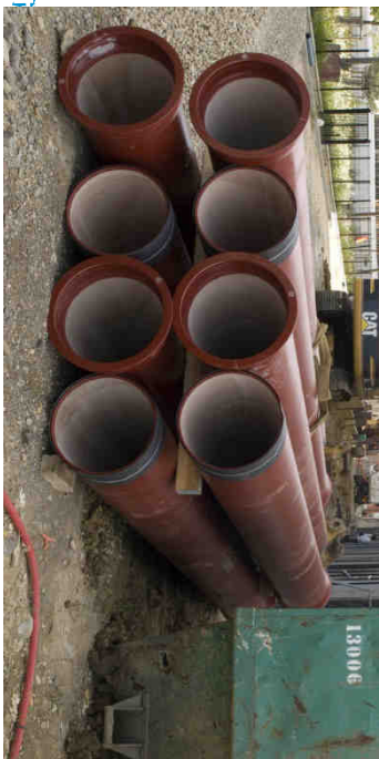
Alain Bernardini « Recadrée. Porte-Image. Dehors # 135, Chantier. Borderouge Nord. Toulouse 2013, Impression sur affiche dos bleu 200 x 100 cm » Commande publique du Centre national des arts plastiques- ministère de la Culture et de la Communication. Production BBB centre d'art